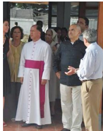
Visita às instalações da Maternidade em Timor, em Março de 2009

dar à luz só recorre ao hospital quando está mal e já em último caso. É evidente que há aqui um trabalho muito importante a desenvolver. O que gostaríamos de fazer seria dar formação a profissionais, que estão dispersos em pequenos postos de saúde no território, por forma a habilitá-los a detectar as gravidezes de risco e procurar encorajar essas mulheres a dar à luz em ambiente hospitalar, sem deixar de assistir, mesmo em sua casa, outras mulheres com partos normais. Concebemos na Maternidade de Nossa Senhora de Fátima uma área de residência para grávidas que aguardam o momento de dar à luz e a quem foi diagnosticada gravidez de risco, destinada, exactamente, a acolher as mulheres nestas condições.